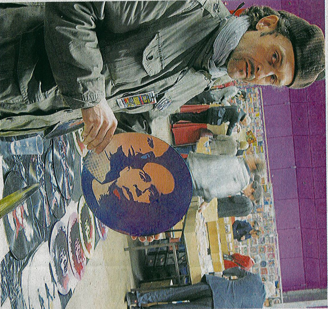
Rezé, la Tocardière : des vinyles art street, c'est au salon du disque : organisé par l'association pour le don de sang bénévole, 4 000 collectionneurs sont attendus de 10 h à 18 h (entrée : 2 €).