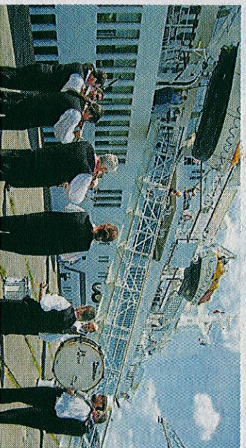
Le « MS Spirit of Adventure » vient tous les 2 ans à Nantes.

Battant pavillon des Bahamas, le MS Spirit of Adventure transporte plus de 300 passagers britanniques et 200 membres d'équipage. D'une longueur de 139,30