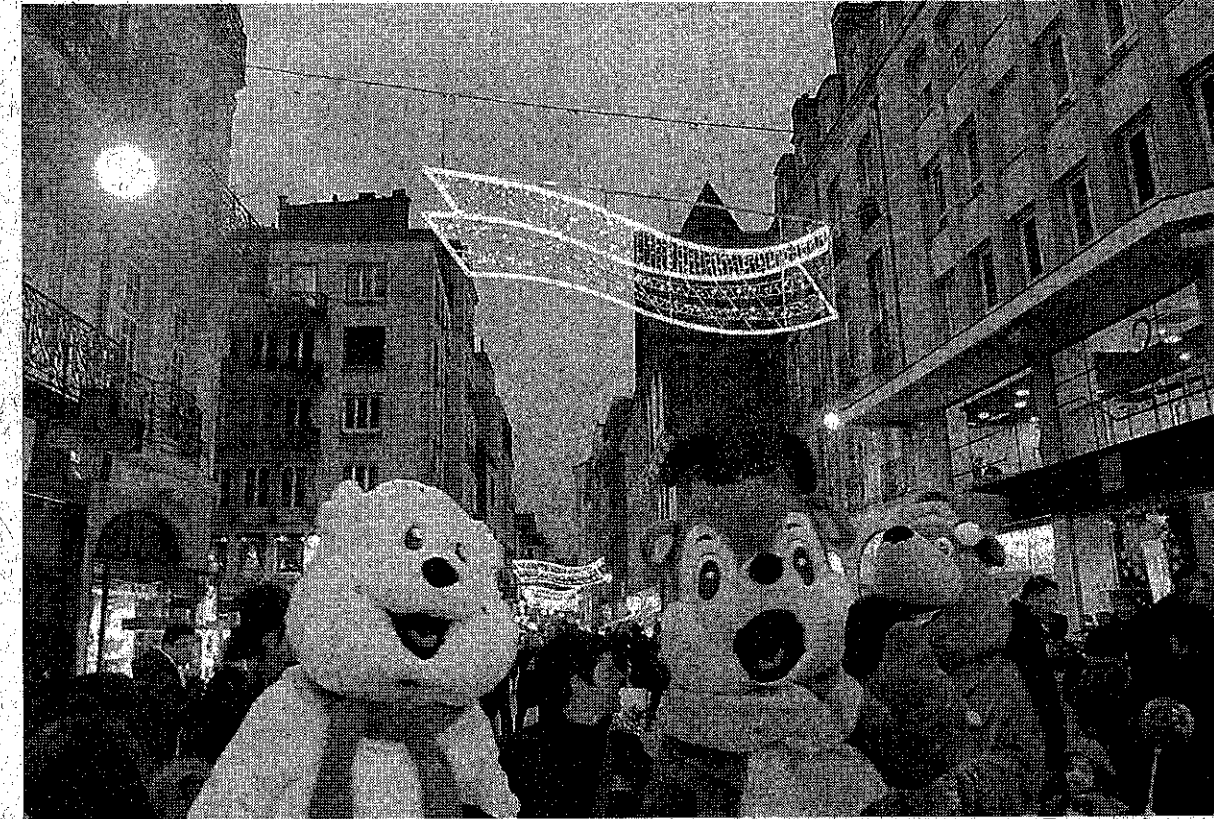
Rue Créb', les animations ont commencé.

Noël traditionnel du 26 novembre au 25 décembre, avec plus de 110 exposants : environ une vingtaine d'exposants alimentaires, quatre-vingts artisans, place Royale et place du Commerce.